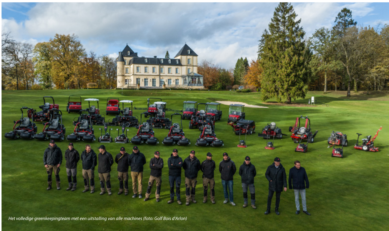
Het volledige greenkeepingteam met een uitstalling van alle machines