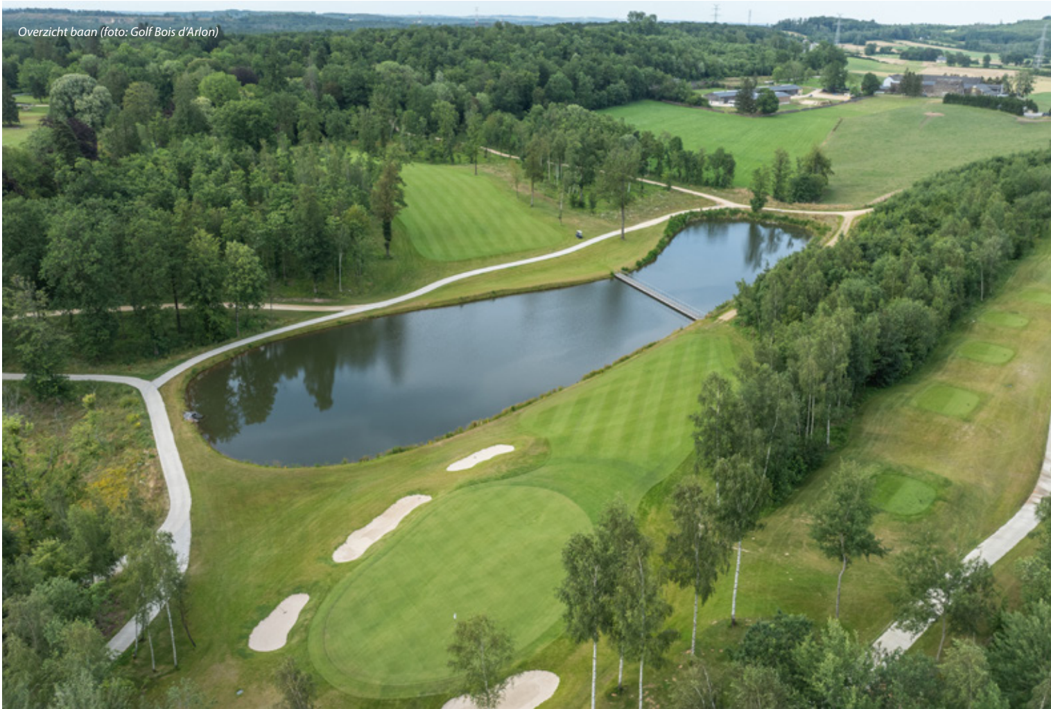
Overzicht baan