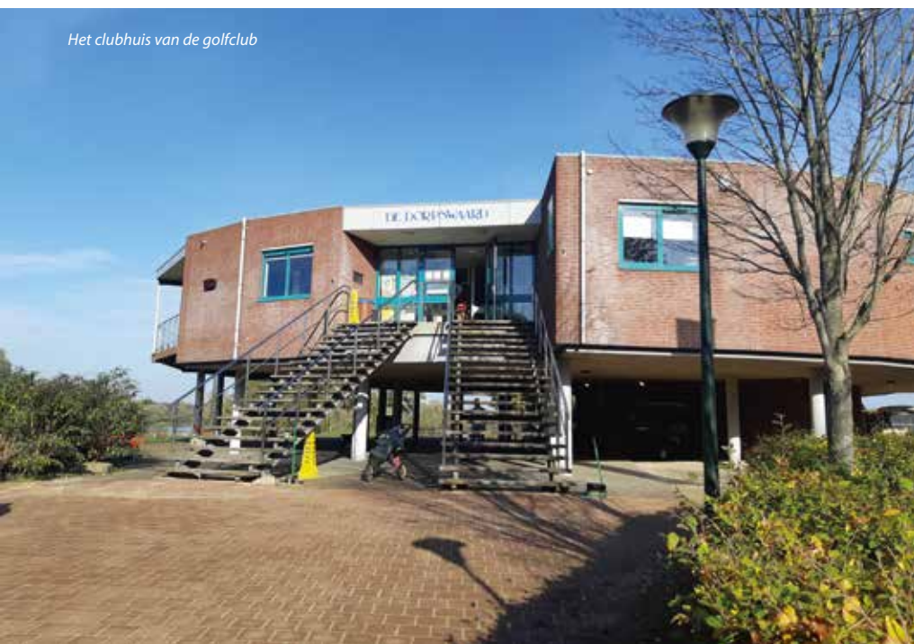
Het clubhuis van de golfclub