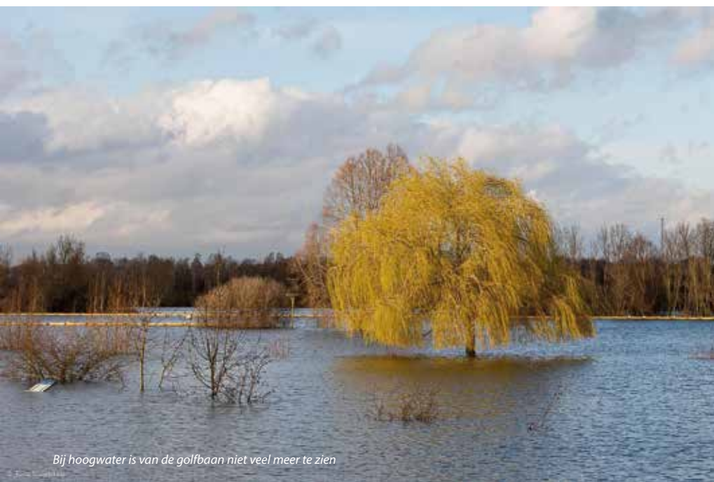
Bij hoogwater is van de golfbaan niet veel meer te zien