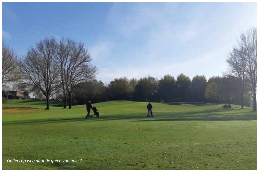
Golfers op weg naar de green van hole 2