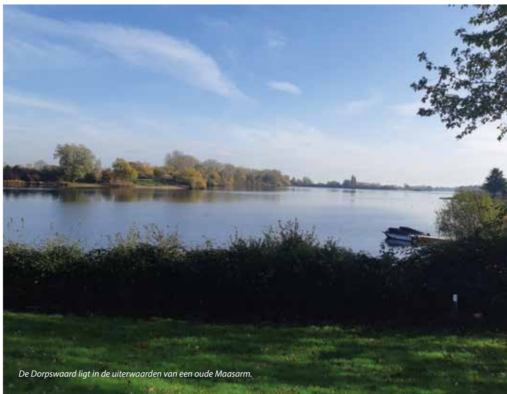
De Dorpswaard ligt in de uiterwaarden van een oude Maasarm.