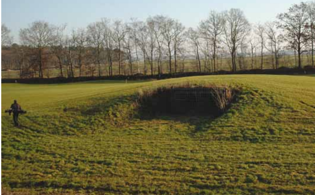
Vleermuiselder op golfbaan Martensplek.

zelfs hier is schoon water geen vanzelfsprekendheid meer en zijn er grondstoffen in omloop met een negatieve impact.