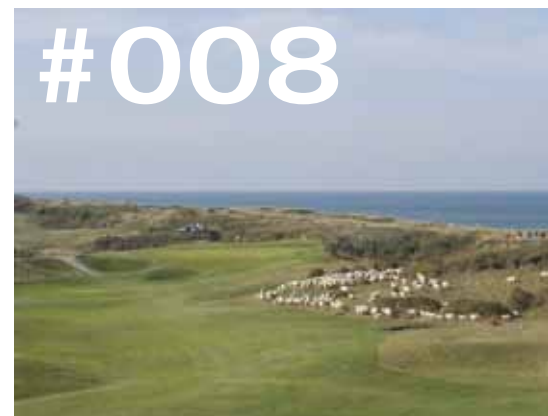
Schape bij hole 1 op Domburgsche Golfclub.