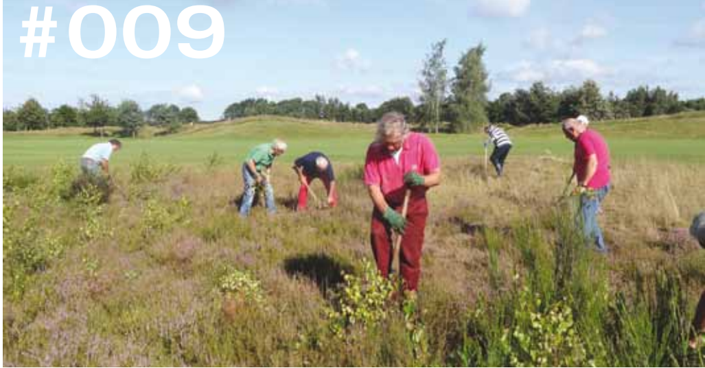
Beheer van de rough op de Gelpenberg door vrijwilligers.