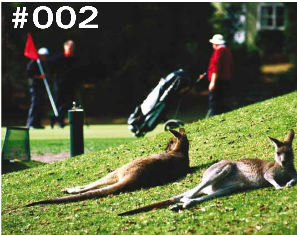
Luierende kangoeroes op de golfbaan.