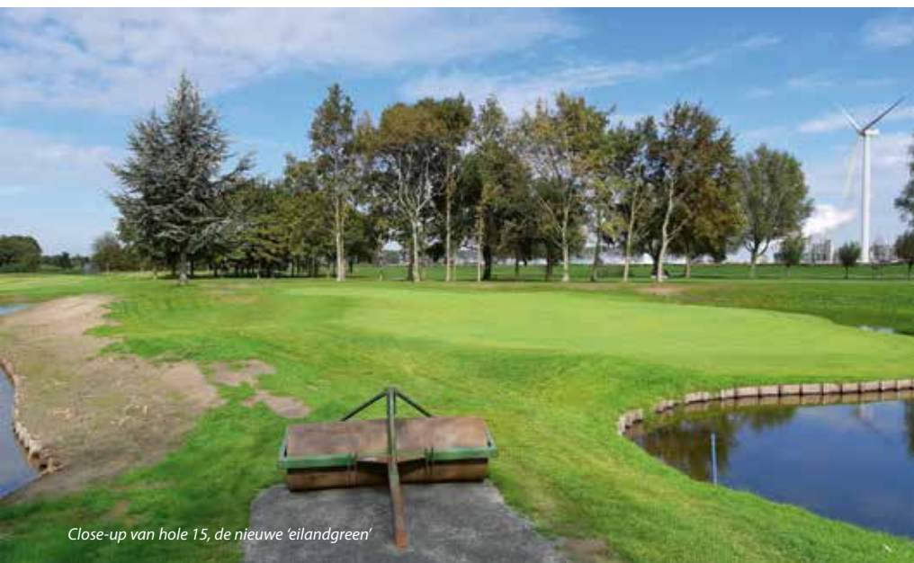
Close-up van hole 15, de nieuwe 'eilandgreen'

Naast het reguliere onderhoud kijken Oosthoek en Kleiburg voortdurend waar de baan verder te verbeteren is. Zo zijn onder meer de paden aangepakt. Vroeger had Kleiburg gewassen schelpen op de paden liggen, maar die verpulverden. In overleg met de aannemer is de baan overgestapt op Schots graniet, een steenachtig materiaal. Leeuwenkamp: 'Het blijft beter liggen, we hebben er minder onderhoud aan en de kosten zijn lager. Ook op die manier maken we slagen, want dat geld kun je vervolgens weer op een andere manier besteden.' Dat geldt ook voor het bunkerzand. Het oude bunkerzand op Kleiburg voldeed in principe, maar werd bij langdurige warmte erg mul en verwaaid snel. Alle bunkers zijn daarom voorzien van Bunkerzand Hoekig van Heicom. De baancommissie kwam het tegen bij het KLM Open op The Dutch, waarna Kleiburg ervoor koos om het bunkerzand ook toe te passen. 'Het nieuwe zand is hoekig, grijpt beter in elkaar en is ook qua onderhoud makkelijker dan het oude. Zo blijf je constant bezig met verbeteren.'