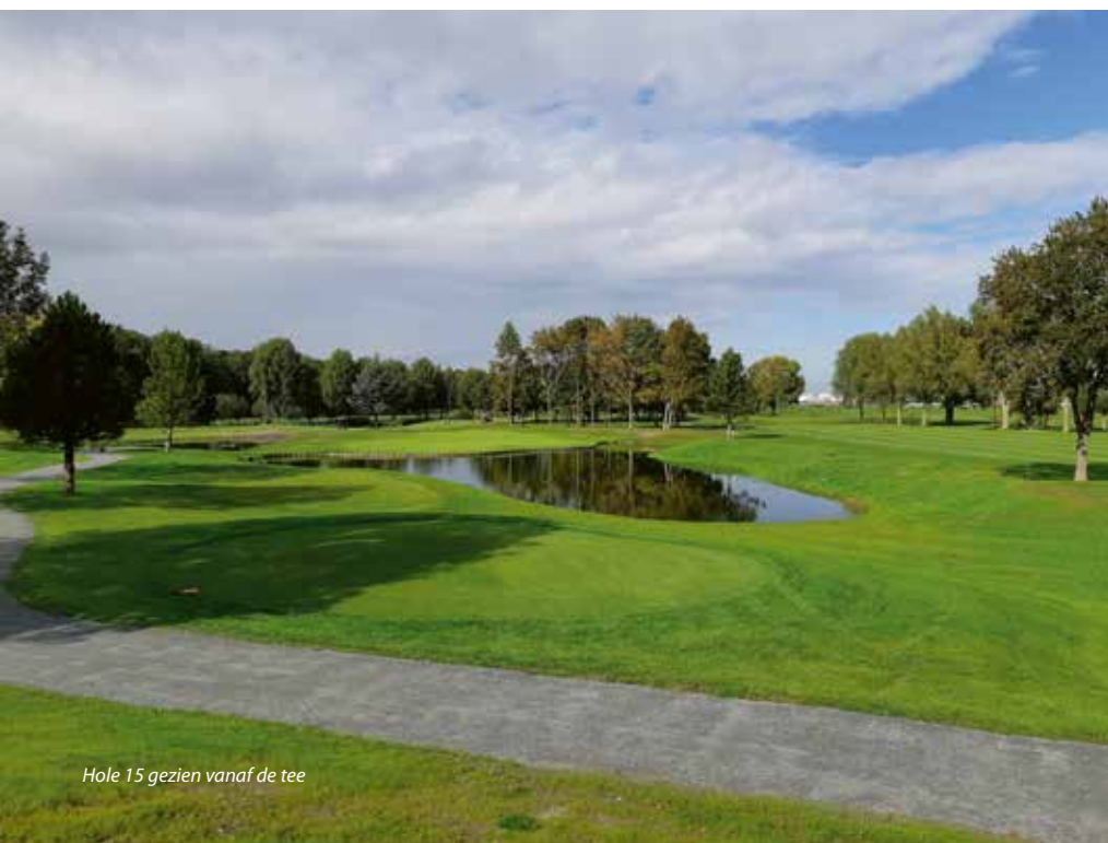
Hole 15 gezien vanaf de tee