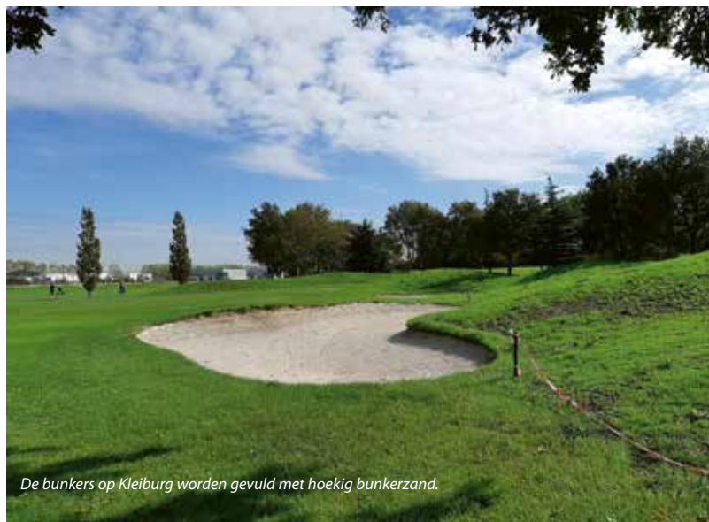
De bunkers op Kleiburg worden gevuld met hoekig bunkerzand.