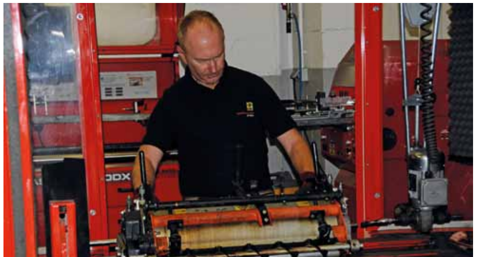
Een perfecte baan met perfect materieel – er is een apart team van drie mensen van slijpbankenfabrikant Bernhard om de kooien scherp te houden.