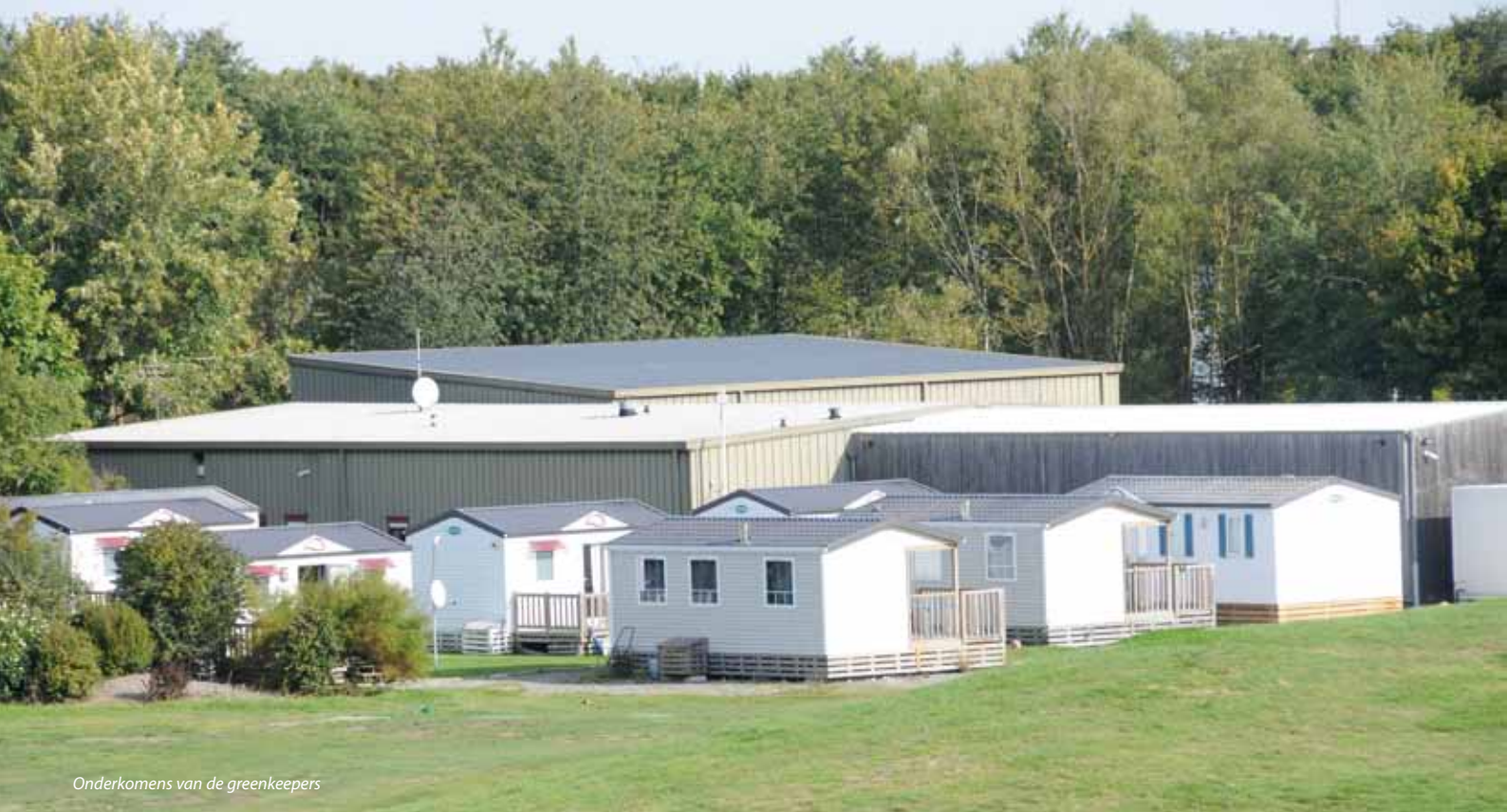
Onderkomens van de greenkeepers