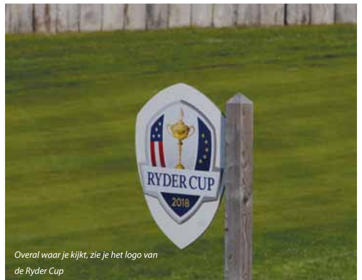
Overal waar je kijkt, zie je het logo van de Ryder Cup

Is Le Golf National een mooie baan? Dat is natuurlijk een vraag naar persoonlijke smaak en voorkeur. Persoonlijk ben ik meer een fan van banen waar de natuur en natuurbeleving op nummer één staan. Dat is op Le Golf National niet het geval. Hier gaat het om golf en golf alleen, en alleen al gelet op de constante stroom Japanse, Chinese en Amerikaanse golftoeristen lijken ze daarin goed geslaagd. Wat daarbij helpt, is dat je die greenfee-spelers kunt lokken met het Ryder Cup-logo.