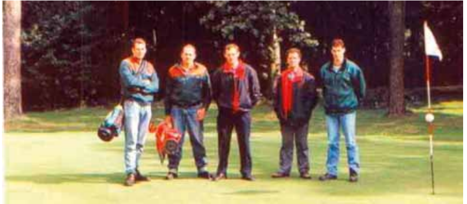
Het team van de Hilversumsche