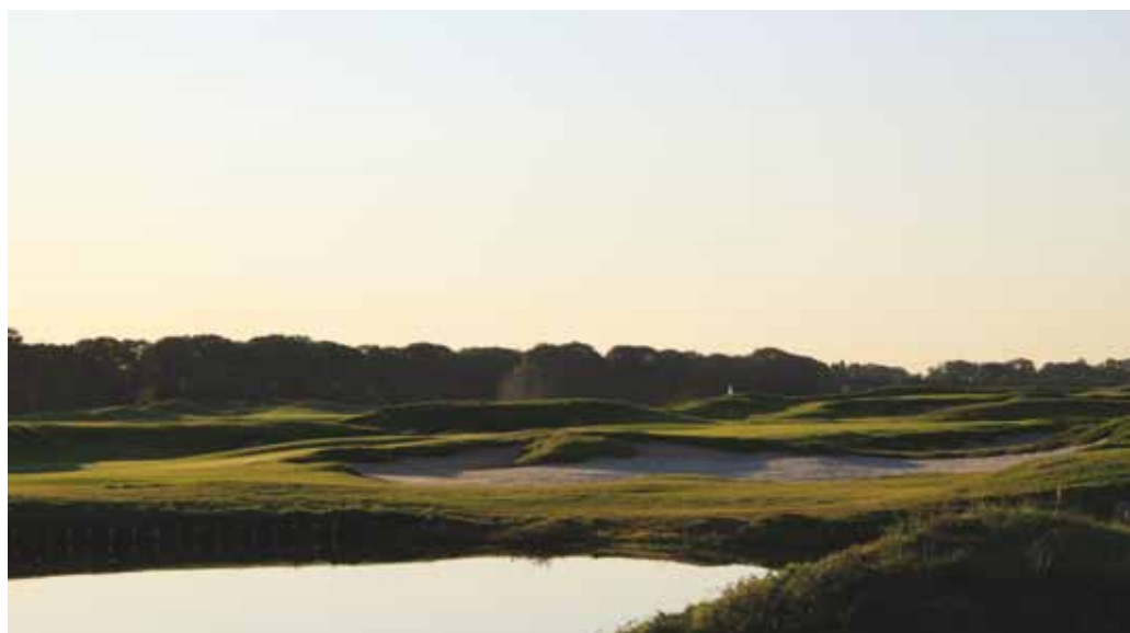
De golfbaan is ontworpen door Gerard Jol en Michiel van der Vaart van Jol Golf Design. Foto: Michiel van der Vaart.

In potentie potentie bedraagt de beschikbare ruimte voor gebiedontwikkeling in het Amsterdamsche Veld 500 ha