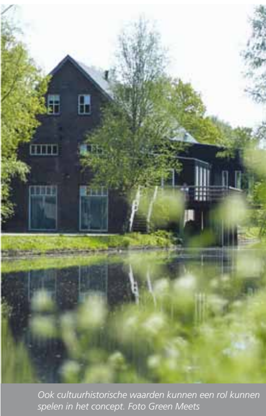
Ook cultuurhistorische waarden kunnen een rol kunnen spelen in het concept.

Het concept van Griendtsveen is op zijn minst gezegd een voorbeeld van duurzaamheid en maatschappelijke betrokkenheid. Het totale gebied beslaat ruim 300 hectare en is in een vroeg planstadium intensief besproken met de lokale overheden. Het concept is uitgebreid getoetst met een Milieueffect Rapportage (MER), waarbij werd gekeken naar de effecten op het water, de ecologie, geluidshinder, veiligheid en landschappelijke waarden. Ook is gekeken op welke manier de cultuurhistorische waarden een rol kunnen spelen in het concept. Voorbeelden hiervan zijn de gerestaureerde Fijnfabriek en de bouw van een nieuw hoofdgebouw voor het