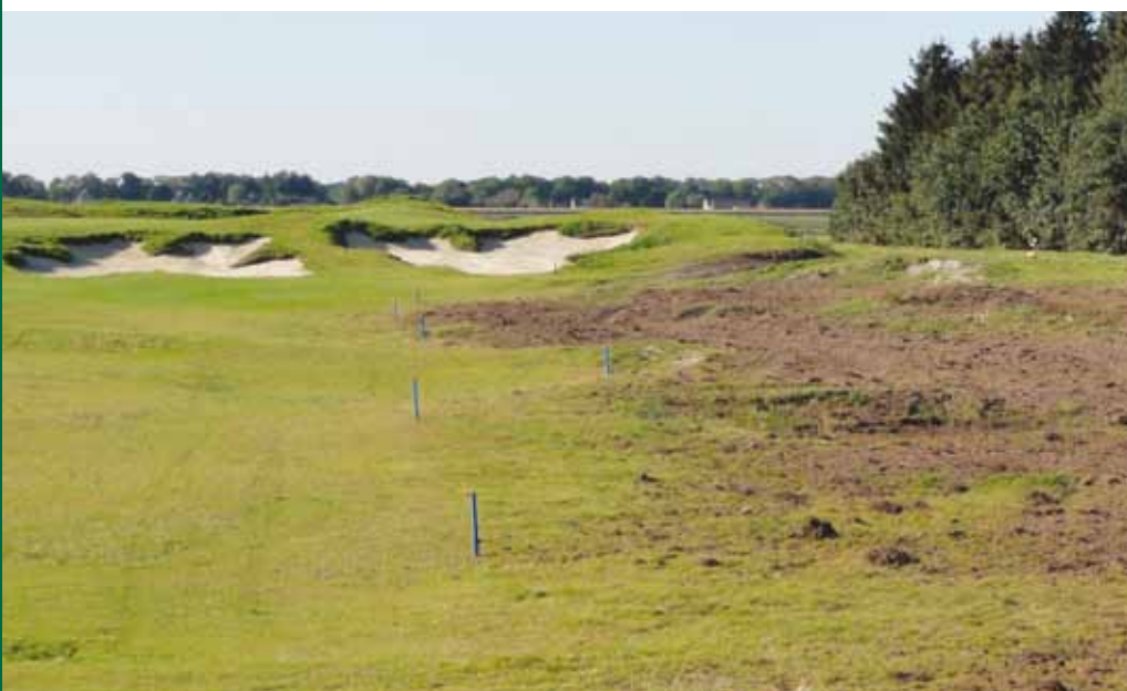
Aanvankelijk een minimale vrijheid om hoogteverschillen aan te brengen.

grensoverschrijdende Naturpark Bourtanger Moor ( http://www.naturpark-moor.eu/de/naturpark/ ). Een deel van dit gebied is gelegen in Nederland en een deel in Duitsland. Door een digitaal informatiepaneel in de lobby van het hotel worden bezoekers direct gewezen op de nabijheid ervan.