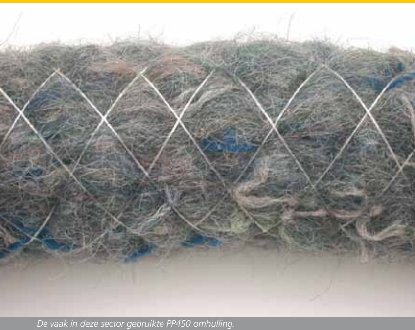
De vaak in deze sector gebruikte PP450 omhulling.