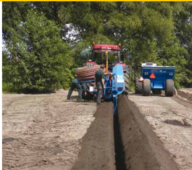
Bij aanleg wordt de drain in het zand gelegd.

eenvoudig in aanleg, onderhoud en relatief goedkoop.