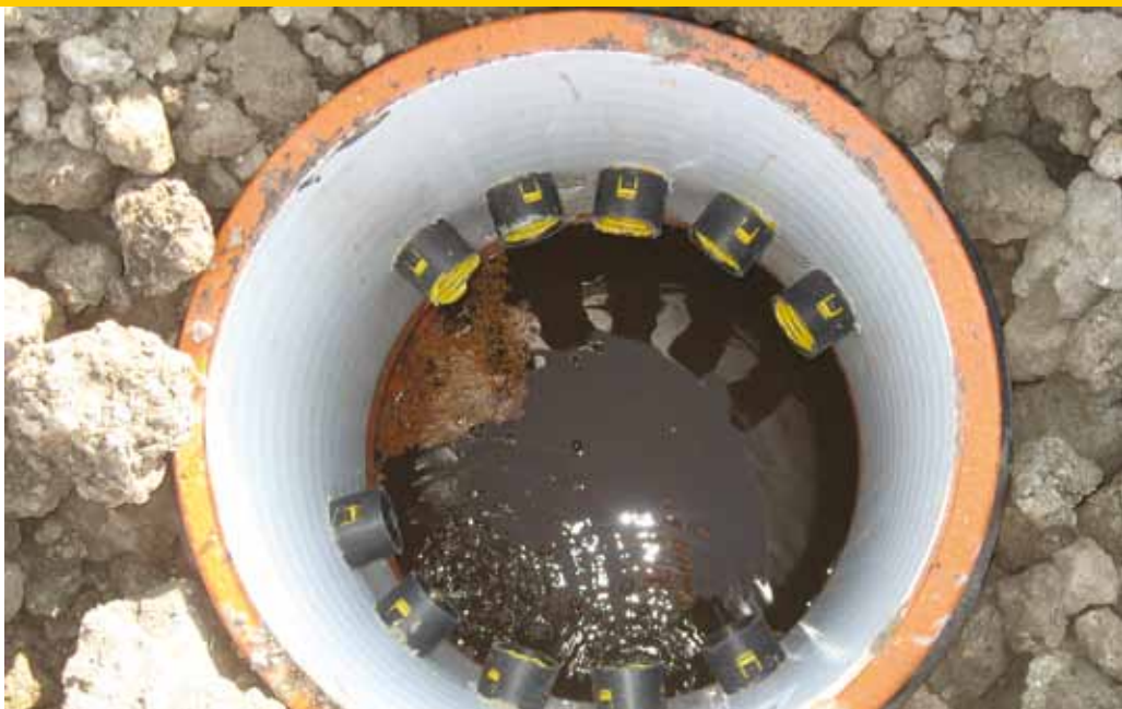
Verzamelput waarop een aantal drains uitkomen.

een afvoermeting te doen wordt duidelijk of het water de drains snel genoeg weet te bereiken.