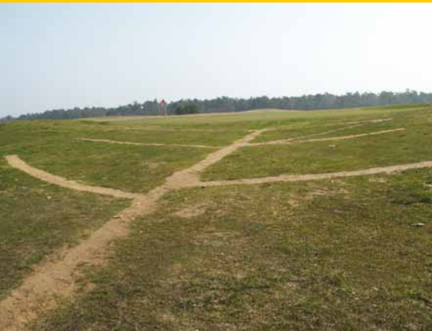
Bij een visgraatdrainage monden de zuigdrains via een Y-stuk uit op een hoofddrain.