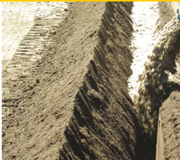
Opvullen drainagesleuf bij voorkeur met gecertificeerd M3c- of M3d-zand.

zakkingen te voorkomen is het belangrijk dat de sleufbodem geen losse grond bevat. Naast de diepte vergt ook het afschot aandacht bij de aanleg (zie onder aanleg-constructie)