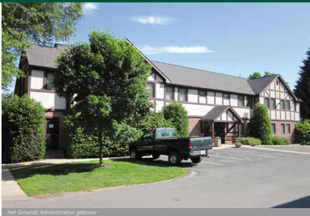
Het Grounds Administration gebouw

"De drie als laatst overgebleven kandidaten werden gevraagd een rapport te schrijven met aanbevelingen voor de korte en lange termijn aangaande het golfbaanonderhoud", zegt Kuhns. "Alle drie bevelen we een nieuwe onderhoudsloods aan. Als de club serieus was over haar ambitie om het onderhoudsniveau van de golfbanen te verhogen, moest het starten met nieuw materieel, een plaats om er aan te werken