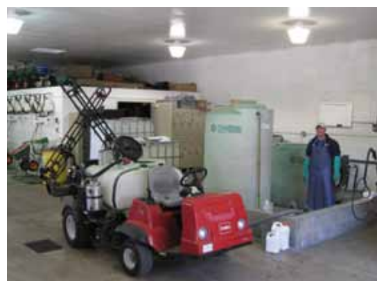
Foto 2: Binnenin het Fertilizer, Pesticide & Water Management gebouw.