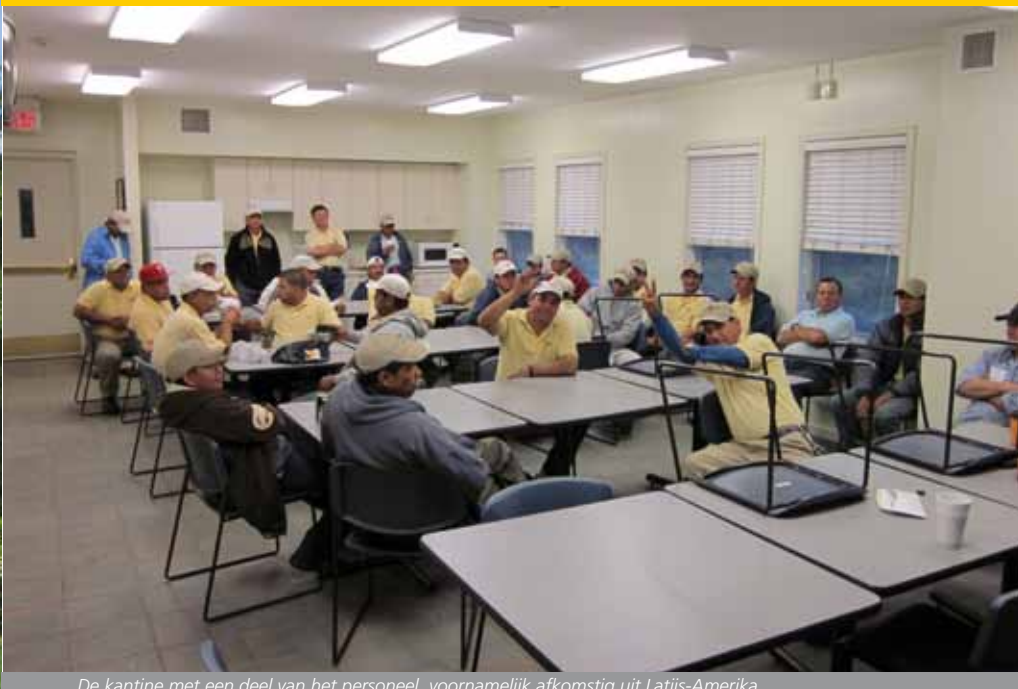
De kantine met een deel van het personeel, voornamelijk afkomstig uit Latijns-Amerika.

en het te herbergen. Toentertijd was het bestaande materieel en de faciliteiten namelijk compleet inadequaats.