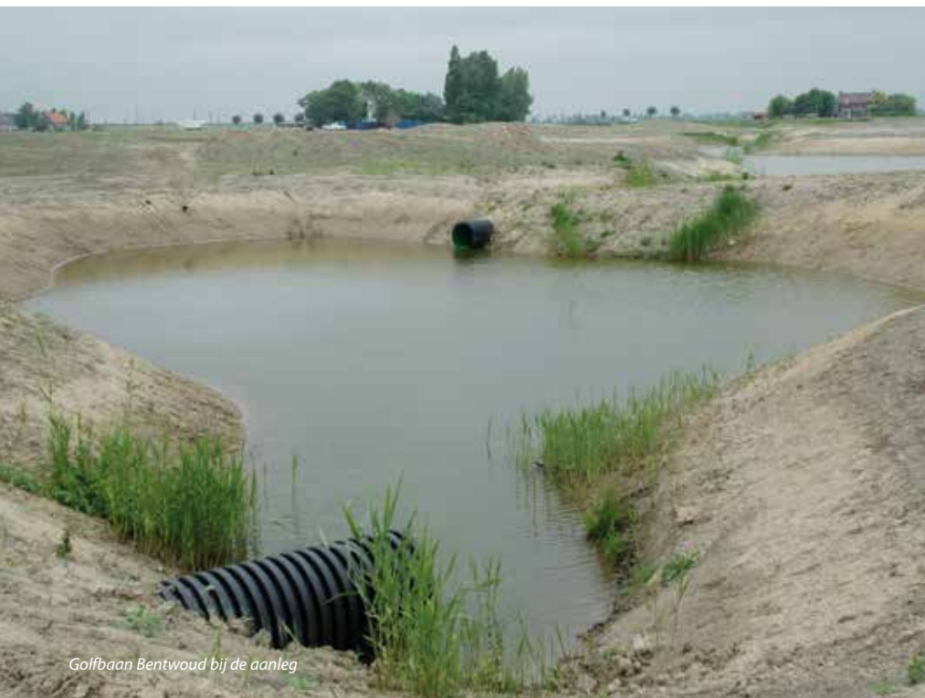
Golfbaan Bentwoud bij de aanleg