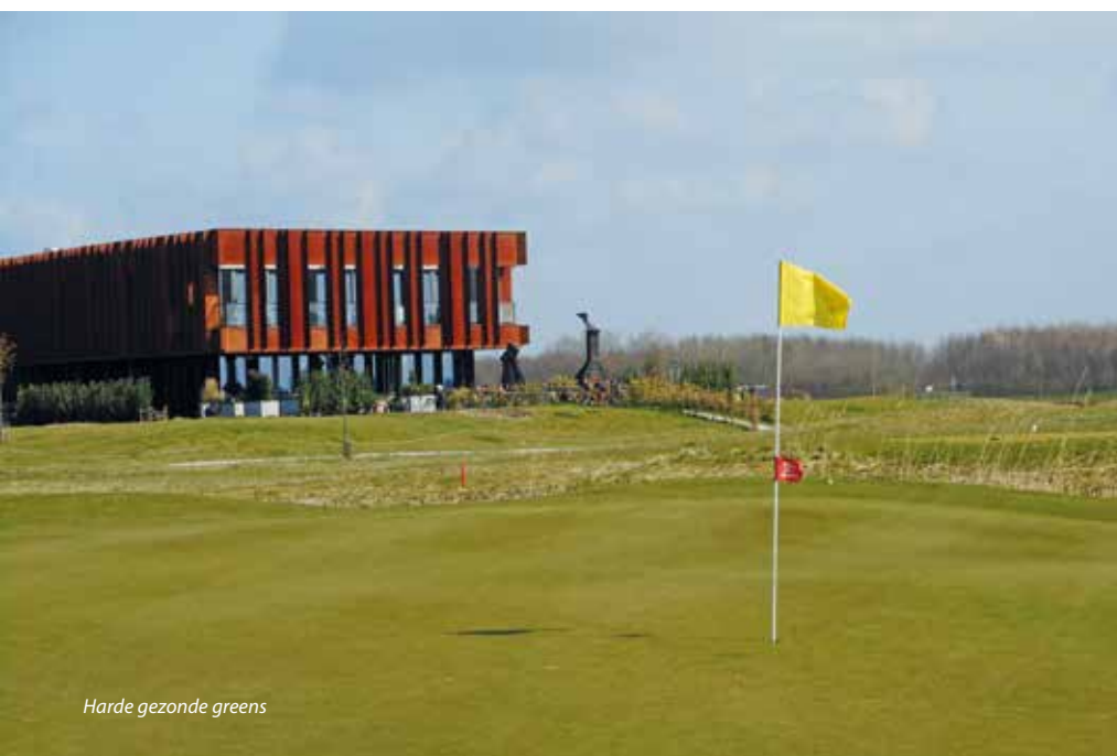
Harde gezonde greens

www.greenkeeper.nl/article/28819/no-nonsensebaan-met-greens-voor-de-toekomst