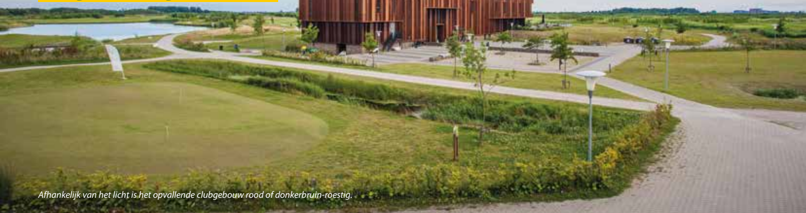
Afhankelijk van het licht is het opvallende clubgebouw rood of donkerbruin-roestig.