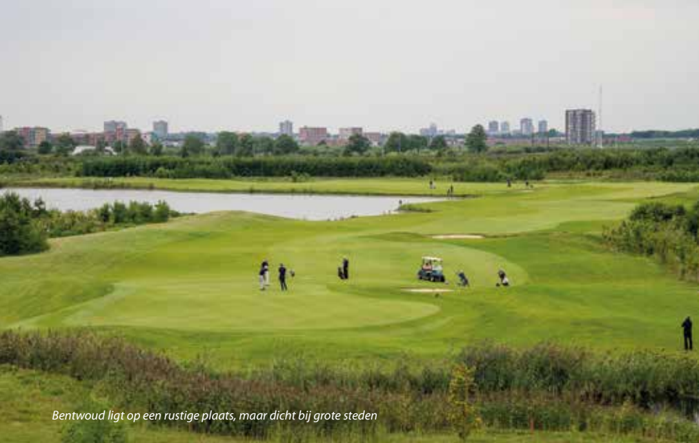
Bentwoud ligt op een rustige plaats, maar dicht bij grote steden