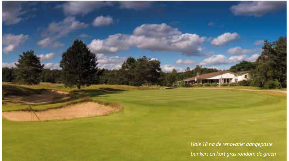
Hole 18 na de renovatie: aangepaste bunkers en kort gras rondom de green

Pont en Van der Vaart betogen dat een baan leuker wordt door een betere plaatsing van de zandhindernissen. Ze benadrukken dat bunkers die met moderne technieken zijn aangelegd, veel onderhoudsvriendelijker zijn. Moderne technieken – bijvoorbeeld bunker matten in de wand of cement of rubberen korrels op de bodem – voorkomen dat de bunkers geregeld inspoelen bij de schaarsere, maar ook extreme buien van tegenwoordig. Ze zorgen er ook voor dat er geen stenen uit de bodem naar boven komen en dat ballen niet pluggen in de bunkerwand. Een goed aangelegde bunker