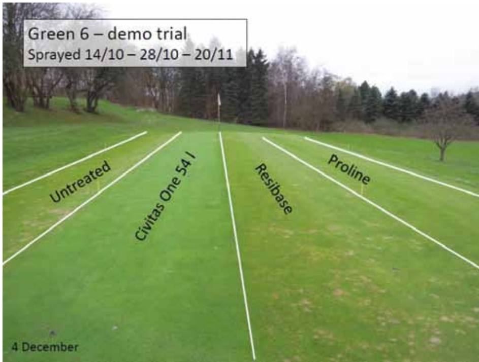
Demonstratie van Civitas One, het fungicide Proline (prothioconazole) en de Resibase op golfbaan Sydsjælland, 9 december 2014.

Voor de Europese markt moet de actieve stof in Civitas eerst een vermelding krijgen op de EU-lijst; dit is zeer kostbaar